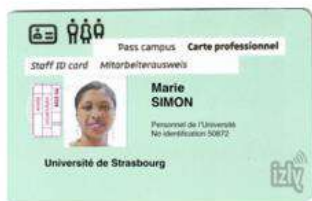
Carte type pour les employés UNISTRA