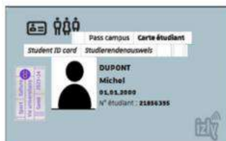
Carte type pour les étudiants